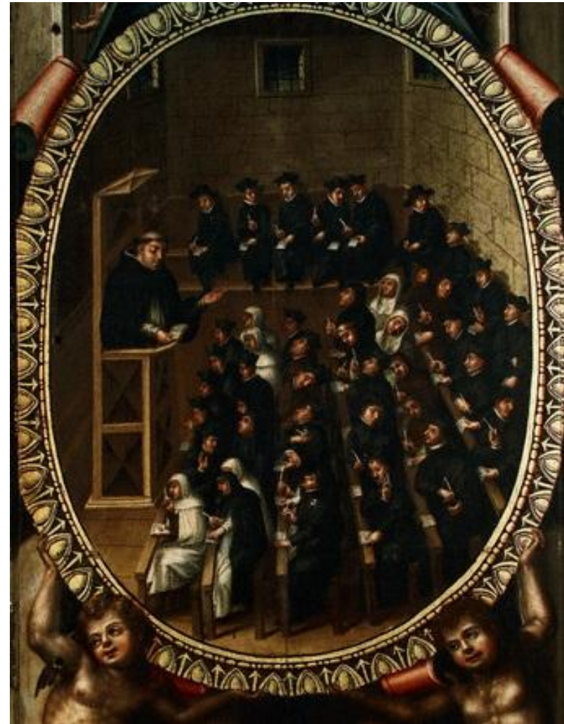
Imagen 3: Lección de teología en la Universidad de Salamanca | Obra de Martín de Cervera | 1614 | Biblioteca Universidad de Salamanca, puertas de un armario barroco.

Con el descubrimiento y conquista de América, la corona española estableció en el nuevo mundo muchas de sus instituciones, como el Cabildo, la Real Audiencia, la Iglesia Católica y naturalmente, fundaron universidades en las Indias Occidentales. La primera universidad en América la dirigieron los dominicos y se constituyó en la isla de Santo Domingo el año 1538. Posteriormente, se organizó la Universidad de San Marcos de Lima, que fue administrada por los dominicos desde el año 1551 hasta el año 1571, en donde se convirtió en Universidad Real. Durante este mismo año se fundó la Universidad Real de México.