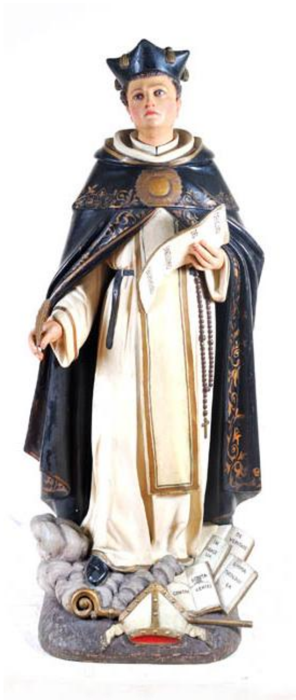
Imagen 2: Escultura “Santo Tomas de Aquino” | Colección Museo Histórico Dominico | Fotografía :Jorge Osorio | N° reg. 97.0414

Las primeras universidades surgen durante el siglo XI, como pequeñas organizaciones de profesores y estudiantes que se reunían para estudiar teología, derecho, filosofía, entre otras disciplinas. Estos centros de estudios se establecieron en las principales ciudades de Europa Occidental, como París, Oxford, Bolonia, Alcalá, entre otras. En las facultades los estudiantes debatían con sus profesores distintos temas, siendo uno de los docentes más destacados de éstas primeras universidades Santo Tomás de Aquino, maestro de teología en la Universidad de París (véase imagen 2).