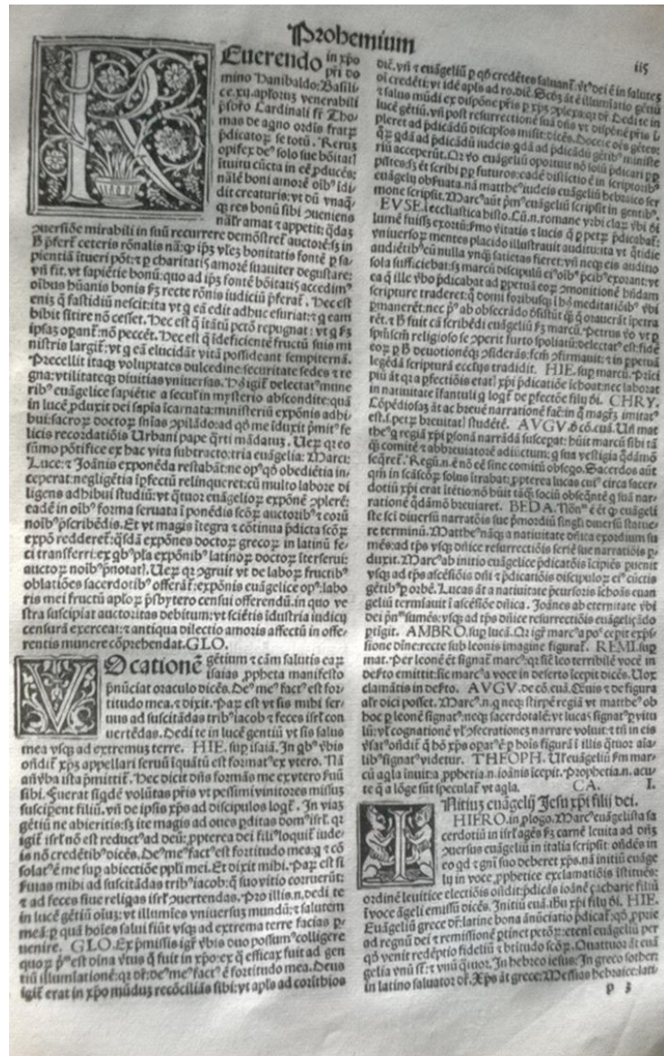
Imagen 9 -10 : Texto Catena aurea, seu continuum in quattuor evangelistas | Tomas de Aquino | Venecia, 1506 | Fondo bibliográfico de la Biblioteca Patrimonial Recoleta Dominica